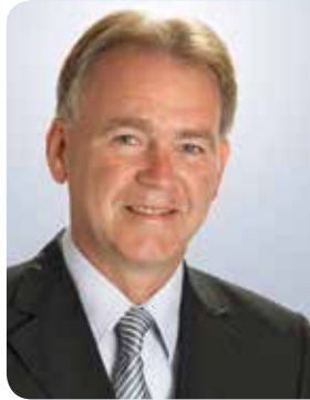
Wolfgang Koch Bürgermeister